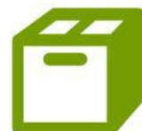
ENVASES Y EMBALAJES