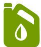
ACEITES Y LUBRICANTES